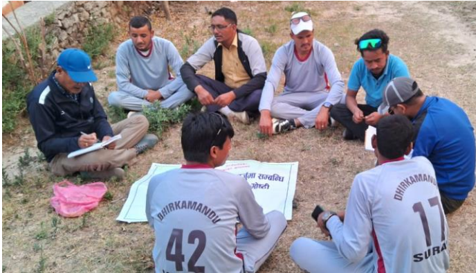
वडा नं ५ धिर्कामाण्डौ, बोगटान फुडसिल गाउँपालिका डोटी