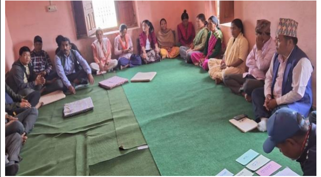
वडास्तरीय सूचना संकलन गोष्ठीका सहभागीहरु सिमचौर १ बोगटान फुडसिल गाउँपालिका, डोटी