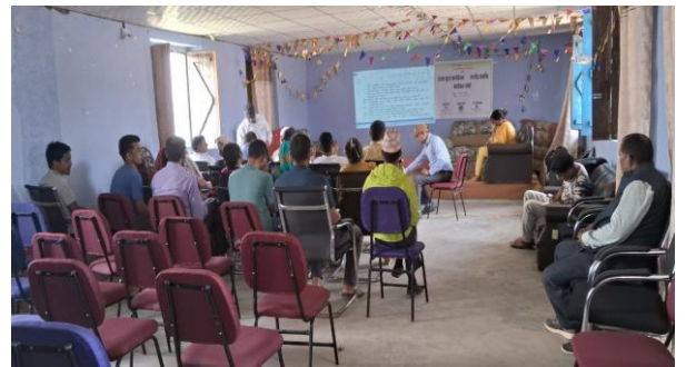
मस्यौदा सम्बन्धी कार्याशाला गोष्ठीका सहभागीहरु