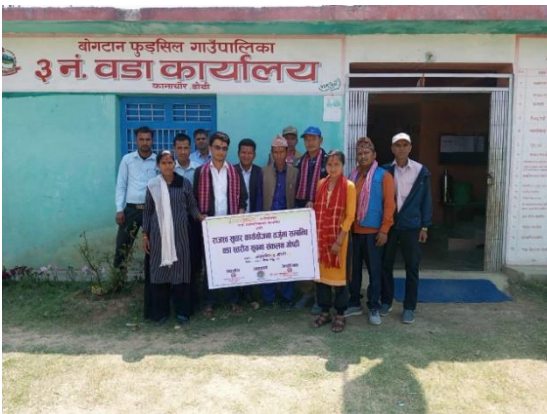
वडा नं ३ कानाचौर, बोगटान फुडसिल गाउँपालिका डोटी