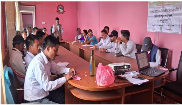
पालिका तहको अभिमुखीकरण कार्यक्रमका सहभागीहरु