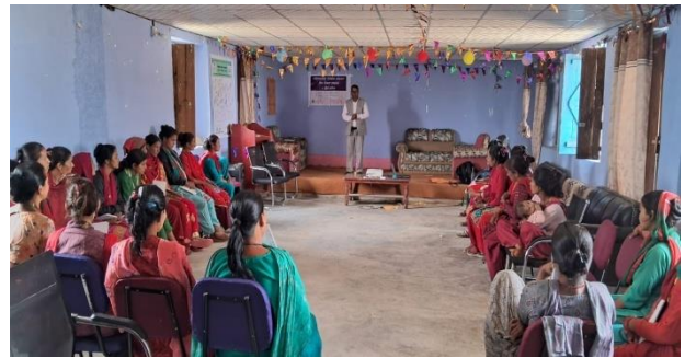
वडा नं ७ खत्याडी बोगटान फुडसिल गाउँपालिका डोटी