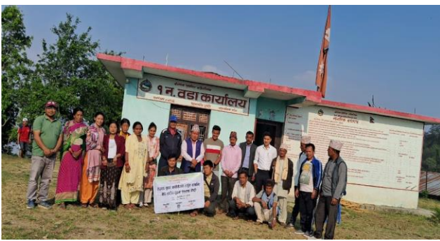
वडा नं १, सिमचौर बोगटान फुडसिल गाउँपालिका डोटी