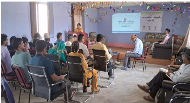
मस्यौदा सम्बन्धी कार्याशाला गोष्ठीका सहभागीहरुलाई स्वागत गर्दै उपाध्यक्ष श्री बिष्णा देवि बमज्यू