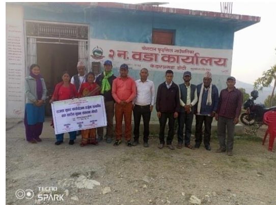
वडा नं २ केदारअखडा, बोगटान फुडसिल गाउँपालिका डोटी