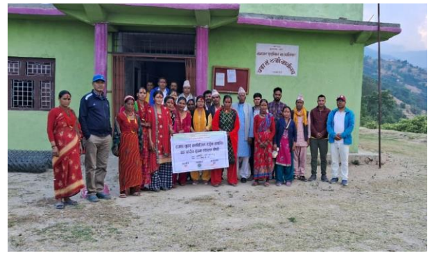
वडास्तरीय सूचना संकलन गोष्ठी वडा नं ४ सातफरी, बोगटान फुडसिल गाउँपालिका डोटी